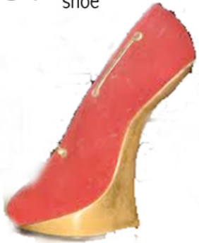
3. André Perugia 'Heel-less shoe'