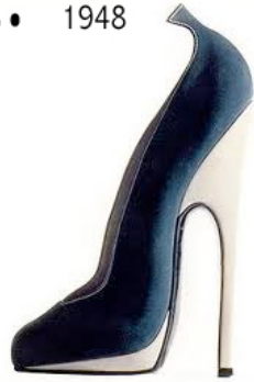
2. André Perugia 1948