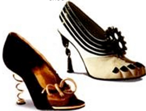
4. André Perugia 'Spiral-heel shoe'