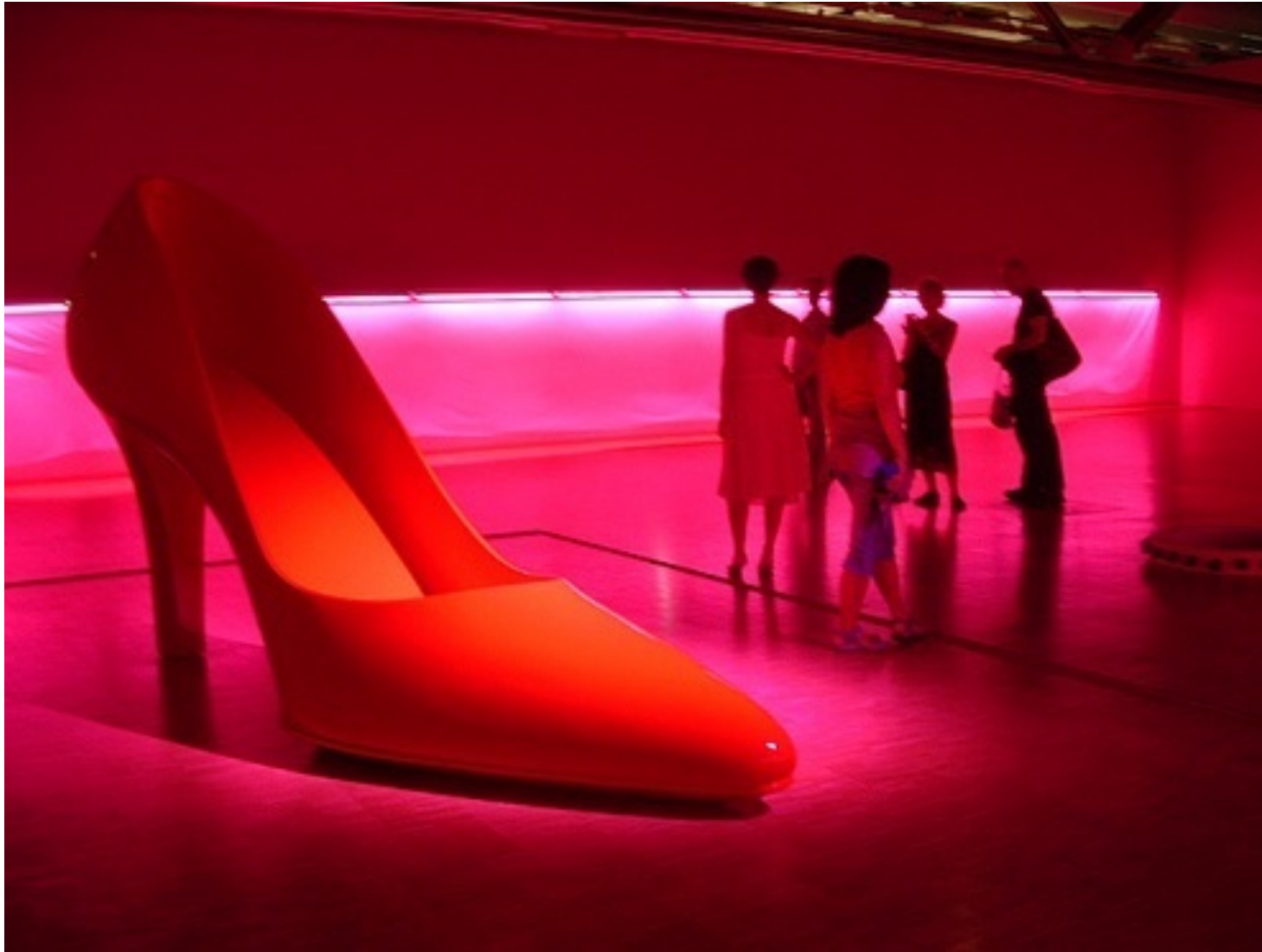
Claude Lévèque-Valstar Barbie-2003, Installation.